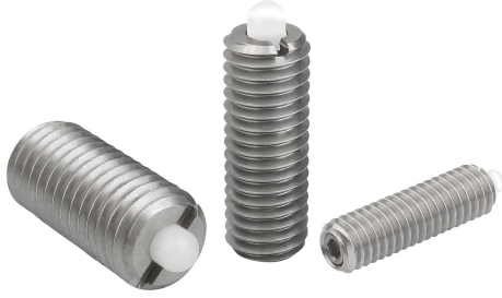
Bir toplam kesitte baskı pimi