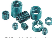
Tekli yedek dişli elemanlar